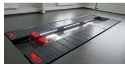
Fußbodenbündiger Einbau im Rechteckausschnitt