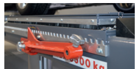
Schiebeplatte, Zahnleiste und MKS-Konsole