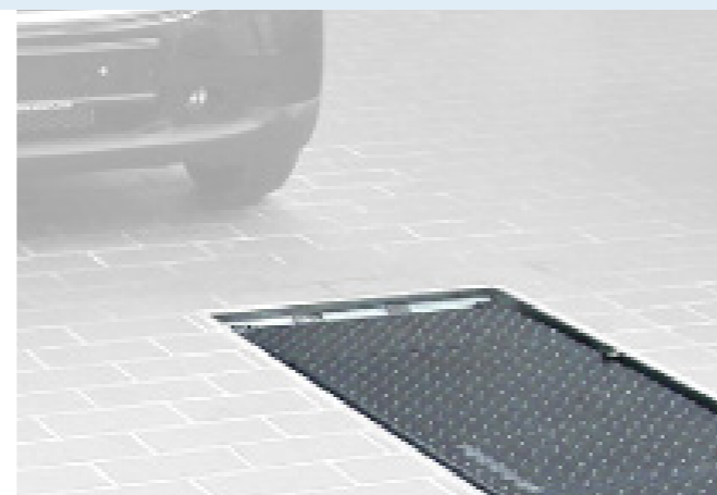
Bodenebener Einbau möglich