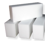
Polymerauflagen 100 x 150 x 340 mm