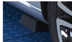
Pyramidenstumpf aus Gummi