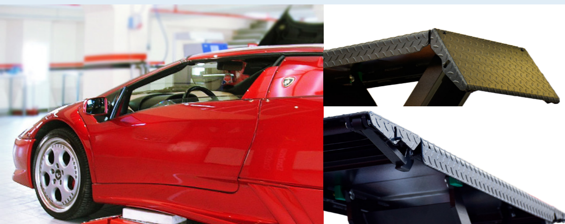
Sehr flache Konstruktion: Perfekt für Sportwagen

JUMBO LIFT NT 3500, 4000: WIR BIETEN DIE RICHTIGE TRAGKRAFT FÜR JEDE WERKSTATT